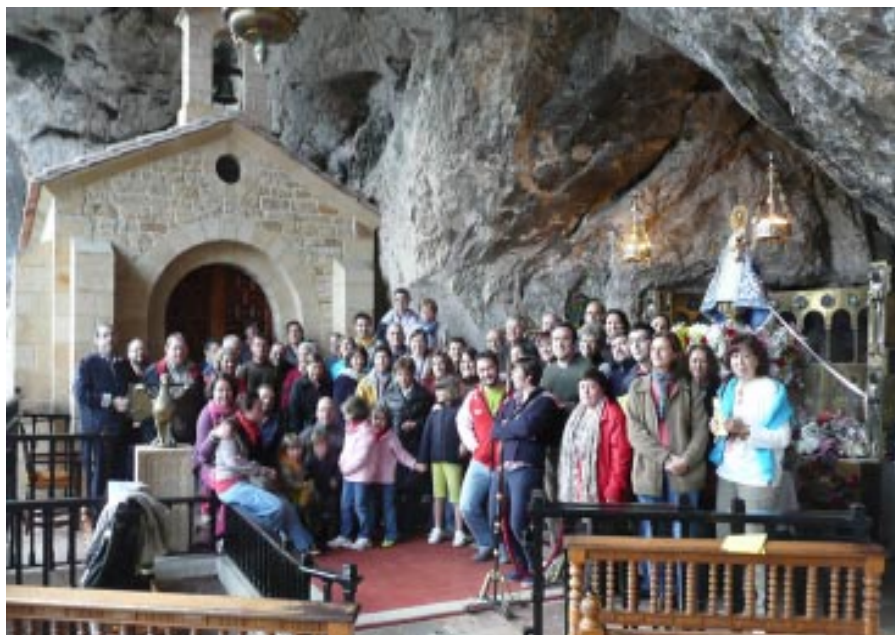
Seglares participantes en la Asamblea.